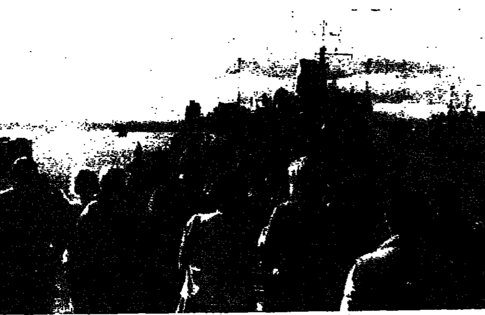
مجلات بصرية بريطانية تروج القربا على من كسحت الغم تغار ميناء سكيكتنديا